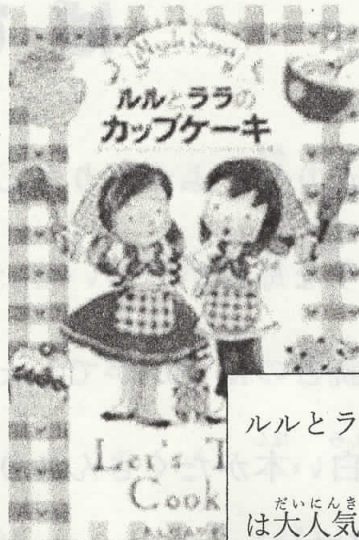
ルルとララシリーズ

よむのにあわせておかしなつくり方までみれるところ。本なのにいつくりたくなる。🍪🍰