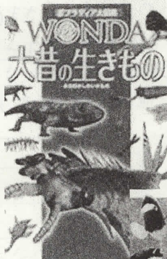
ずかんほんおもしろ 図鑑の本も面白い