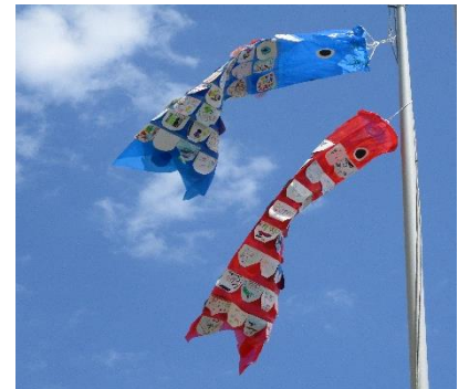
□1年生が作ったこいのぼり

先日、興味深い文章に出会いました。《コミュニケーションとは、「あなたのことがよくわからないから教えてほしい」という姿勢から始まる。「よくわかった」という言葉は相手を少なからず不愉快にする。だから、人間関係は、フエジーな、わからないことが多い方がいい。》といった内容でした。確かに、親子でも友達でも、わかっていないことはたくさんありますね。子どもに対しては、子どもの行動の理由を決めつけず、わかっていると思いつまわずに、「あなたの思っていること、やろうとしたことを教えて」という姿勢の大人でありたいですね。我が身を振り返ってもなかなか難しいことだとは思いますが。人間関係も学習も、わかっていく過程が楽しいように思います。