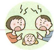
配偶者への暴力や暴言をこどもに見せること