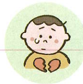
こどもの心や自尊心を傷つけるような言動をしたり、繰り返すこと