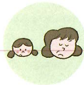
こどもを無視したり、拒否的な態度を示すこと