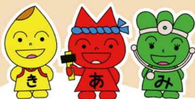
ふじさわバランストリオ