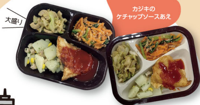
カジキのケチャップソースあえ

栄養バランスに配慮した献立で、望ましい食習慣の育成や食育を推進しています。また、みなさんの利用希望に沿った予約方法を選択できるなど、利用しやすい給食事業をめざしています。