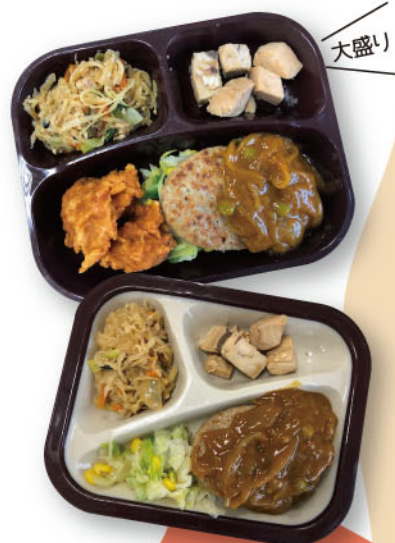
カレーハンバーグ