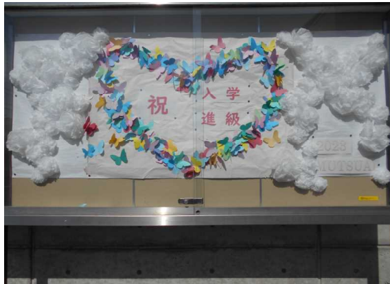
正門横のPTA掲示板 いつもありがとうございます！