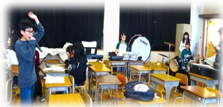
バンドクラブの練習「熱唱！！」