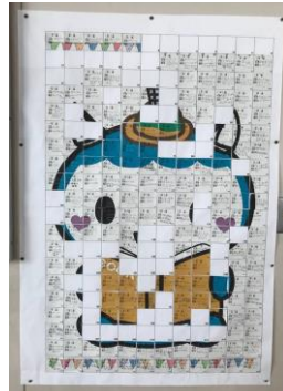
11/18 ふじキュン♡ ぼくなってきました