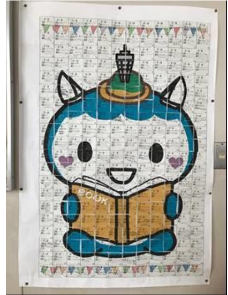
11/25 本を読んでいるふじキュン♡ が完成しました！