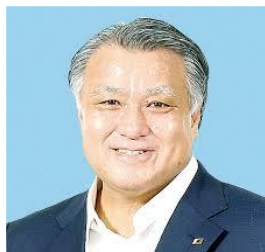
[講師] 田嶋 幸三 氏 日本サッカー協会名誉会長