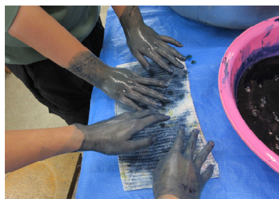
がんばりました！ (ちなみに翌日は鎌倉めぐり)