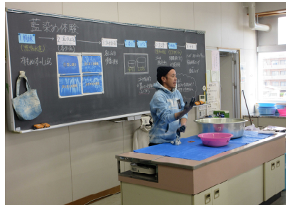
最初に説明を聞きます。