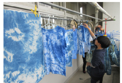
干して乾かします。