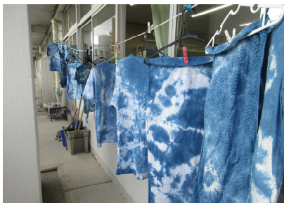
ずらっと並んだ藍色。