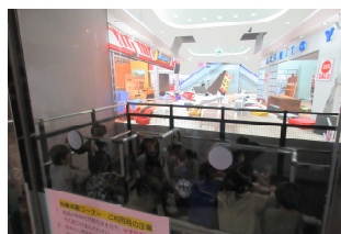
つかまらなると怖かった震度7体験