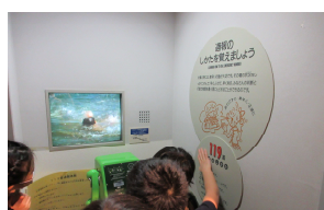
スムーズに119番通報できました