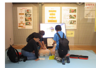
救命救急も体験しました