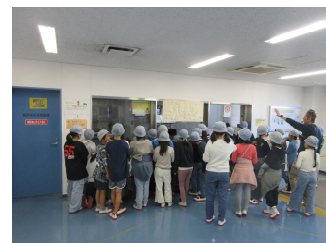
中央制御室の皆さんに感謝