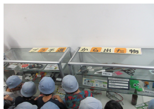
きちんと分別しないといけないと実感