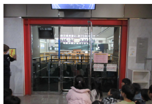
起震体験。かなりリアルです