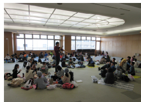
防災センターの講堂でランチ