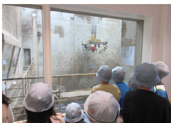
巨大キャッチャーでゴミをピットへ