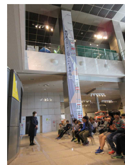
東日本大震災の津波到達地点 はとても高いわかりました