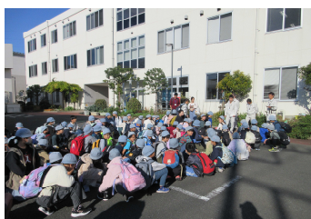
リサイクルプラザの皆さんに挨拶

午後からは、厚木市の防災センターへ。震度7の揺れや風速30mの強風を実際に体験したり、非常時に公衆電話から緊急を知らせる体験などをしたりと、普段はなかなか味わえない特別な活動に、緊張しながらも一生懸命に取り組んでいました。