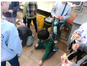
こま回し教室(1・2年)