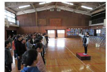
授業参観(4年:学習発表)