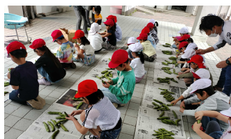
そら豆のさやおき