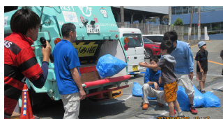
学校にパッカー車が来ました!