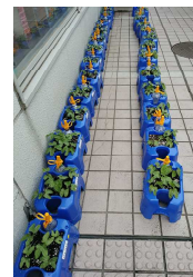
朝顔がぐんぐん成長しています。