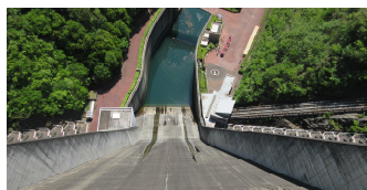
↑ダムの上からの景色 迫力の放水→