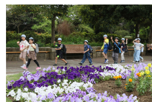
裸足で川に入ったり、きれいな花を見ながら歩いたり。