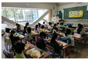
はじめてのソフト麺給食