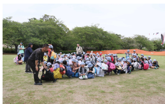
整列や移動がとても上手になりました。