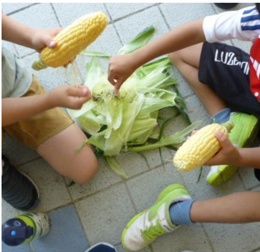
片付けのときに、ゴミをサッと片付けられるように、皮とヒゲが散らばらないように気をつけているグループがありました。そんな工夫ができるなんて、素晴らしいですね！