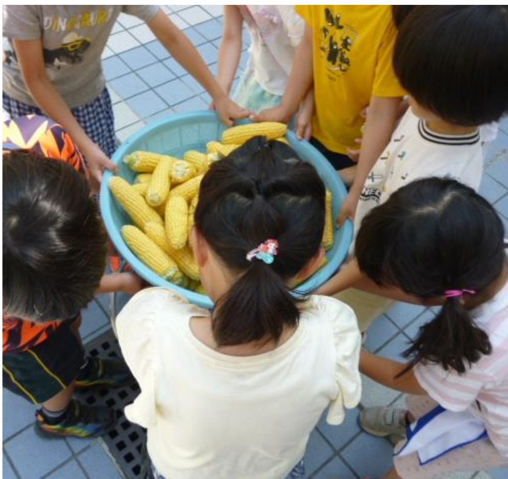
片付けも給食作りの1つの作業です。重たいですが頑張って運んでいました。