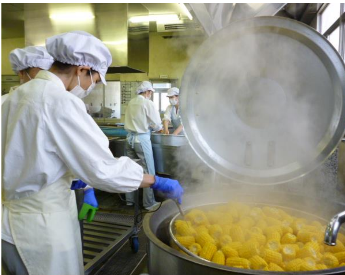
蒸し上がりました！