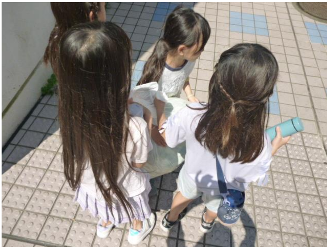
作業が終わったら、とうもろこしと、ゴミ、コンテナ等を給食室に運びます。