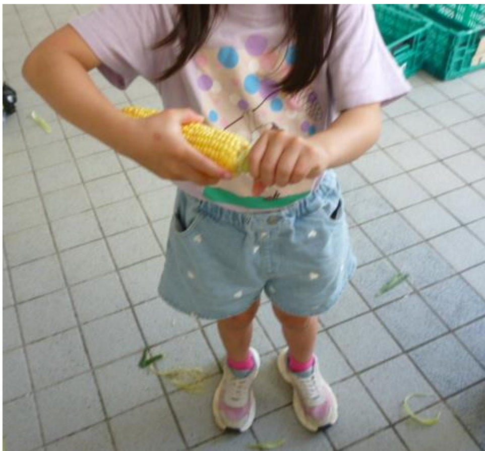
最後に柄の部分折ります