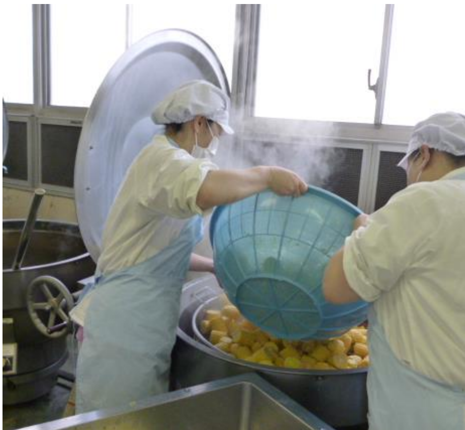
切ったとうもろこしを、大きな釜で蒸します。