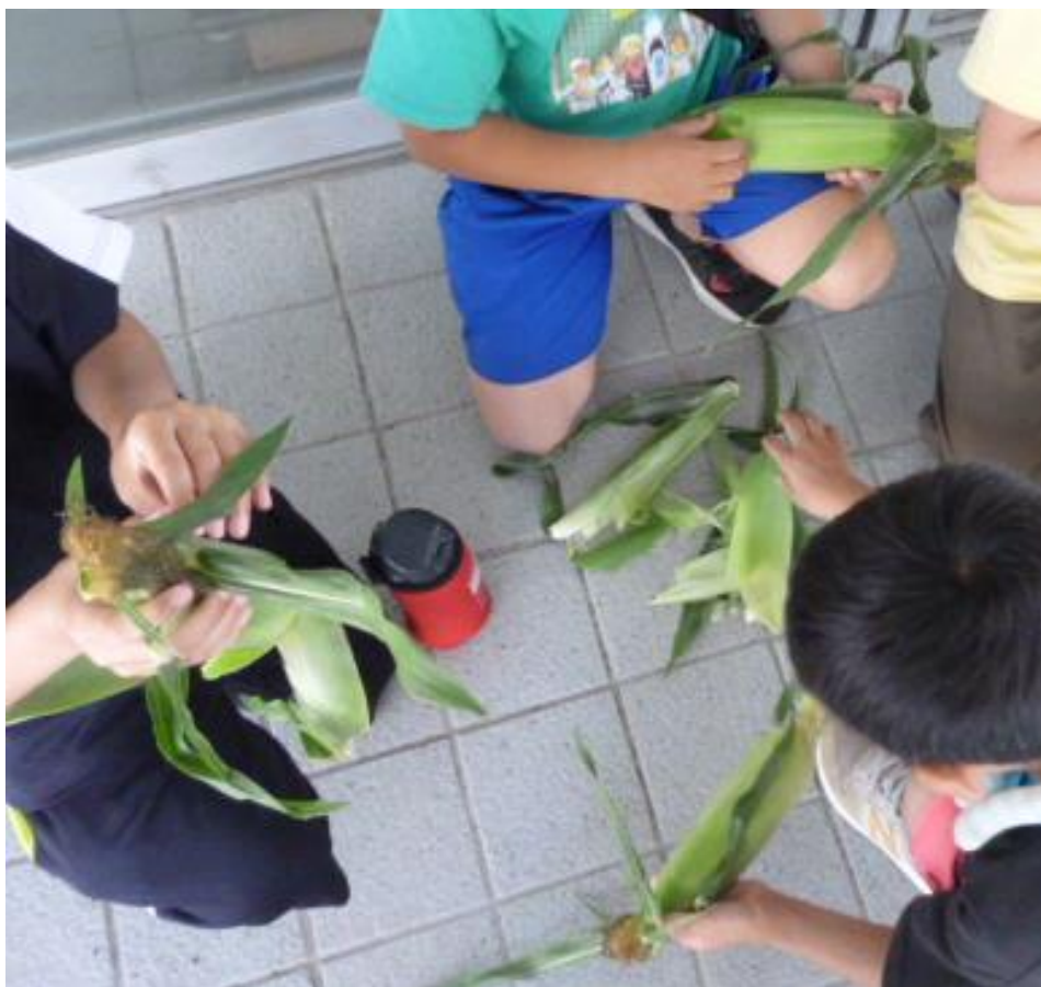
まずは皮をむいて…