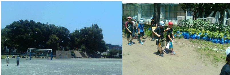
4年 理科 (夏を探そう)