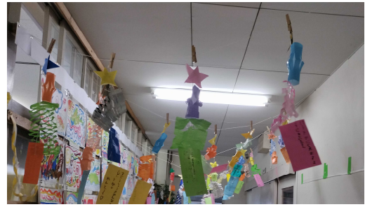
1年 短冊に願い事を書きました