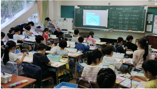
1年 図工 (水彩絵の具)