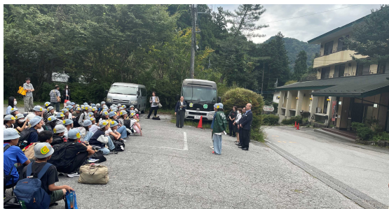
今回の宿「風和里(ふわり)」