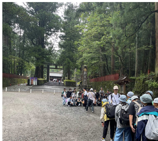
2日目 これから「日光東照宮」に向かいます