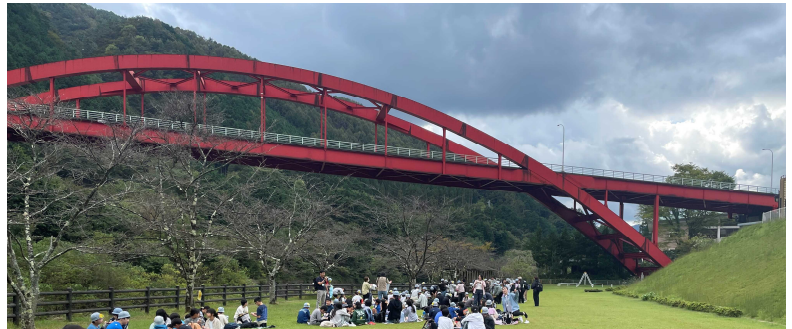
1日目 足尾銅山近くの「日光通洞公園」(昼食)