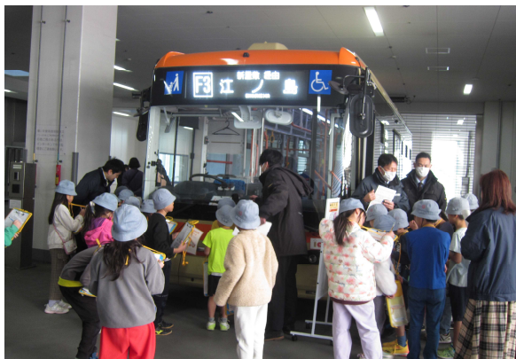
2年生 MM(モビリティ・マネジメント)教育 えのでんバス