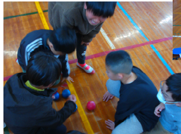
5年生 ポッチャ体験