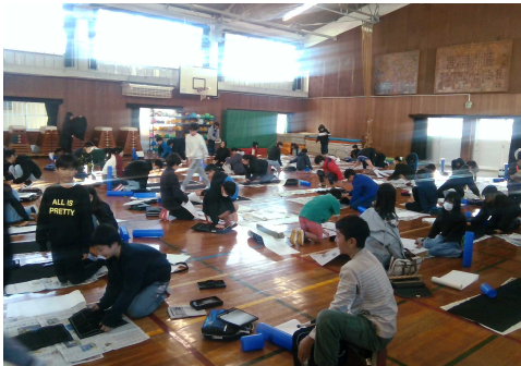
6年生 書き初め大会