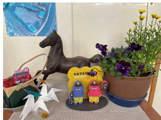
校長室前は、 すでにこんな感じのにぎやかです。