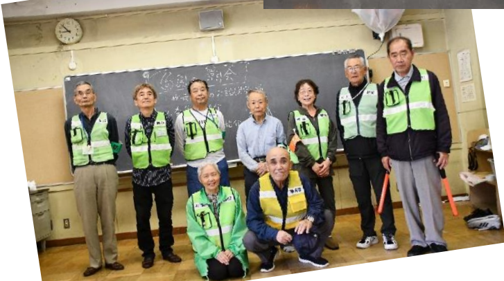
おはようボランティア、東町パトロール隊、スクールガードリーダーのみなさま