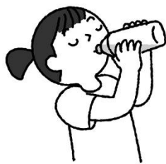
気温が高いときは こまめに水分補給をしよう