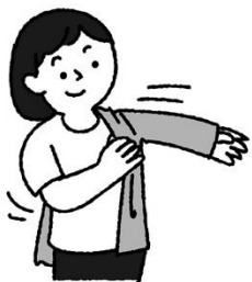
脱ぎ着のしやすい服で 体感温度を調節しよう

5月に入り、寒暖差が大きい日も増えてきました。温度調節ができるようにしておきましょ う！