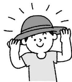
外出のときは帽子をかぶり 紫外線を避けよう