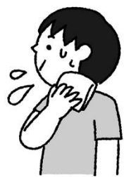
汗をかいたら清潔な タオルやハンカチでふこう