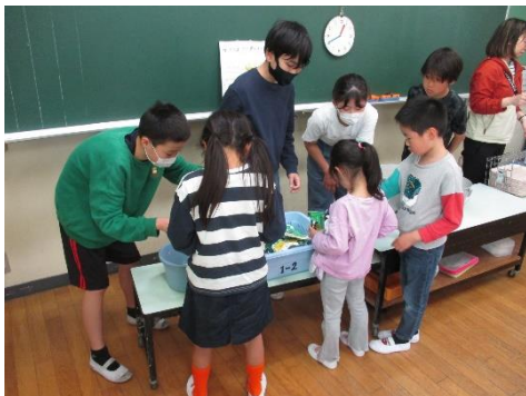
片付けの仕方を、6年生が上手に教えてくれます

6年生代表の迎える言葉はとても立派で、1年生代表の二人の言葉は緊張しながらも一生懸命で、静まり返った体育館全体に「がんばれ！」という“言葉”が浮かんでいるようでした。これで1年生は名実ともに浜見小の仲間入り、活動も本格的になっています。登校時、朝の教室に向かうと、「校長先生！おはようございます！」「うのただし先生だ！」「今日は国語のお勉強があるんだよ。」等、気楽に声をかけてくれるようになりました。