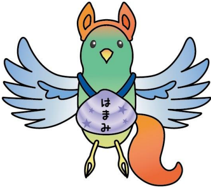
浜見小ゆるキャラ「はまみん」

遅刻・欠席の連絡は連絡フォームをお使いください。上のQRコードをご利用ください！