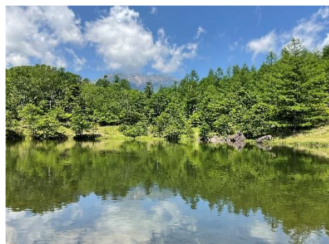
美鈴池からの「逆さハヶ岳」

2日目は、朝（6:15起床）から身支度を整える、寝具を片づける、荷物を整理するなど、どの子どももテキパキとこなし、朝食の前には全て終えることができました。これは個々の素晴らしい取り組みでした。