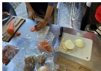
切り方ひとつとっても意見の相違が！

次に「野外炊事」。学校で学習したこと、家庭で教わったことをそれぞれ出し合い、「こっちから切ったらいいよ」「その野菜大きくない？」などと相談しながら色々な切り方で野菜を切り、火起こし体験で点火した火を使ってカレーを煮込みました。できたカレーはどのグループも最高の味だったようです。