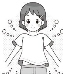
涼しい格好をしよう

ほけんいん 保健委員の5.6年生が、まいにちあつしすう はかり ひょうを もとに ねちゅうしゅうちゅうい ほけんしつまえ にししやうこうぐちよこ けいじ パネルを確認して、熱中症予防にやくだ役立ててみてね。