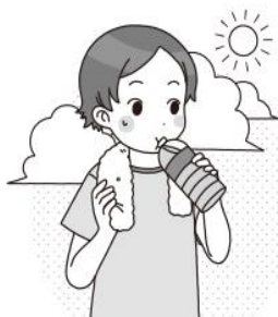
こまめに水分補給