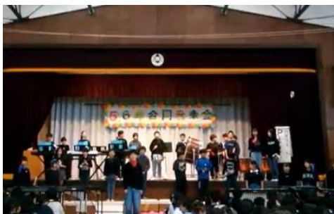
★13日 5・6年合同音楽会★

PTAまつりでは、保護者の皆様、地域の皆様にご協力をいただき、子どもたちが笑顔で楽しい時間を過ごすことができました。ありがとうございました。