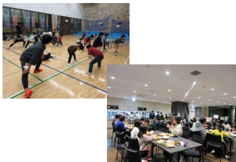
★21～22日 本町級宿泊学習★ (県立スポーツセンター)