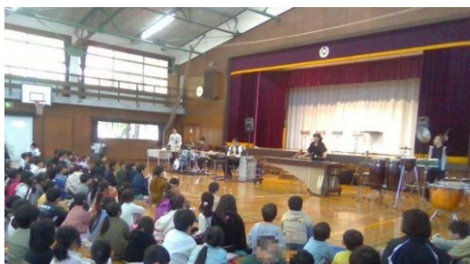
★25日 鑑賞教室★ (パーカッショングループFLOWER BEATさん来校)