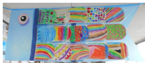
2年生の教室前で泳ぐ鯉のぼり

亀井野小学校は、コミュニティスクールとなって3年目となります。子どもたちの意欲や主体性を大切に、ご家庭や地域との連携しながら教育活動の充実を図っていきます。今後ともどうぞよろしくお願いいたします。