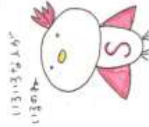
いっしょに いっしょに