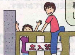
立入禁止場所に入る