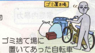
ゴミ捨て場に置いてあった自転車