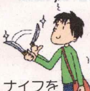
ナイフを持ち歩く