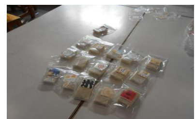
全校児童に渡したものです