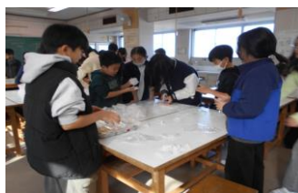
翌日、カット&袋詰め