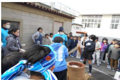
全校児童が見に来てかけ声をかけてくれます。餅をつくのは5年生。