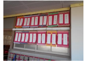
2年「元気にあいさつ」