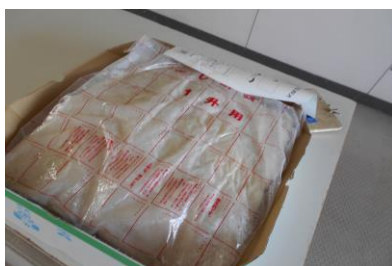
のし餅になりました。