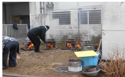
火をおこして蒸します