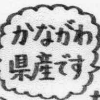
かながわ 県産です