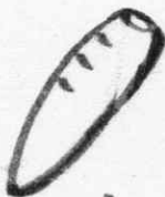
にんじん まやうしよく