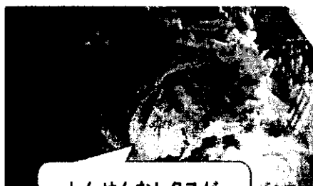
しんせんなレタスが とどきました