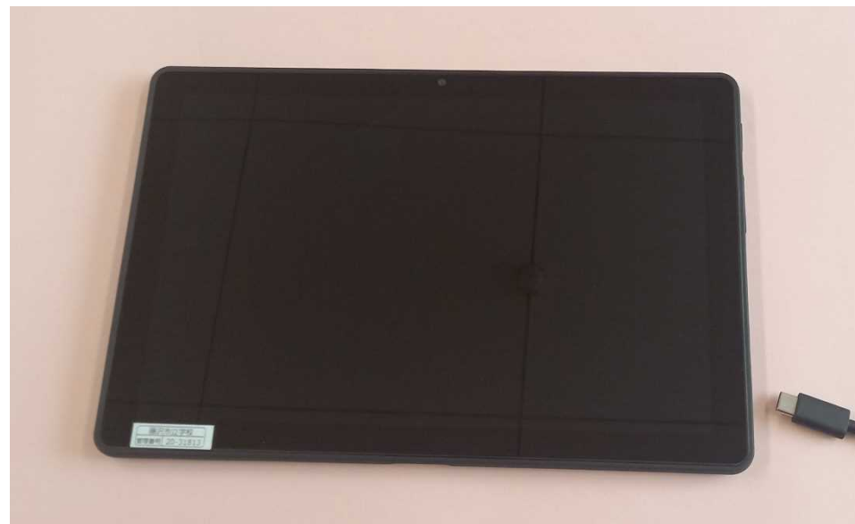
↑ Lenovo chrome