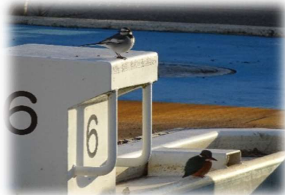
カワセミとセキレイ(上)

子どもたちもプールを覗きながら通っていましたが、子どもの声に驚く ことはありませんでした。みんなの朝の楽しみができたと思っていま したが、4日目の朝にはセキレイだけが来ていて、カワセミの姿はありま せぬでした。また、大庭に来てくれることを期待してしまいます。