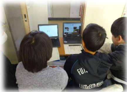
5年生千葉県の小学校と