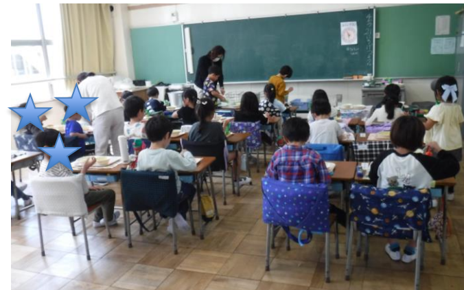
▲ 教室では先生と一緒に6年生たちが牛乳パックの開き方を教えてくれました

1年生 初めての給食は、カレーライスでした！「おいしい！」とたくさんおかわりをしてくれました♪