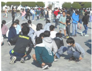
ドッジボール大会