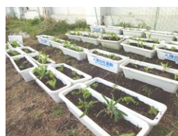
卒業式に飾る花の準備

今年度の卒業式は、 3月19日(火) に実施し、保護者の方の参加は各家庭2名までとさせていただきます。6年生の保護者の皆様には、詳細について後日おたよりを配布いたします。