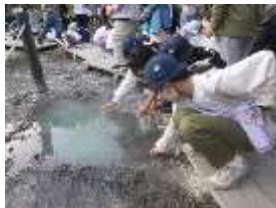
* 源泉で10円玉の色変わるかな