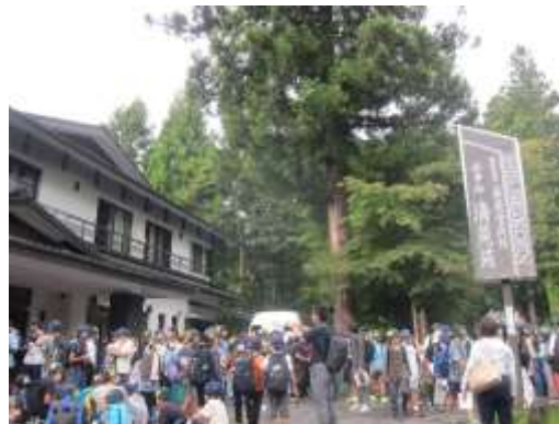
* お世話になった「清晃苑」