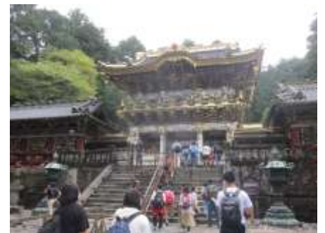
* 日光東照宮の美しい陽明門