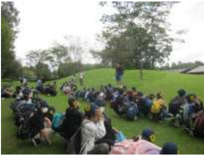
* 大谷川公園でお弁当 SLが通りました！

藤沢市内ではインフルエンザの感染が広がり始めていましたので、3連休明けの当日体調を崩す児童が出ないかととても心配でした。子ども達と一緒に万全の健康状態で参加できるよう準備をしてくださったおうちの方々のおかげで、お迎えをお願いするような事態になることもなく、たくさんの思い出がいっぱいの2日間を過ごすことができました。