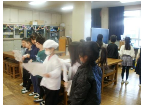
1年生 幼保小交流会

給食、持ち物、勉強、掃除、休み時間等のグループに分かれ、実物や自作のポスターを用いて、学校生活の様子を一生懸命年長さんに伝えていました。すっかりお兄さんお姉さんの顔をしていて、成長を嬉しく感じました。年長さん達は目をキラキラさせながら聞いていました。