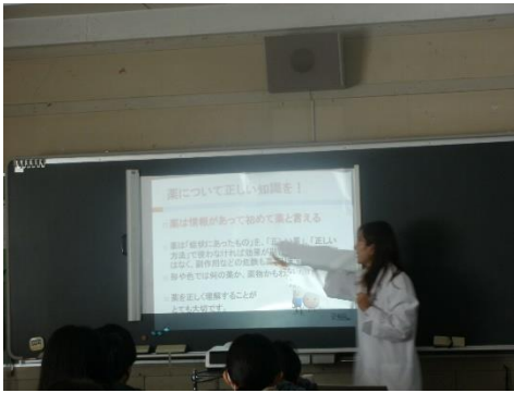
6年生 薬物乱用予防教室

学校薬剤師を講師としてお招きして、薬についての正しい知識や薬物を乱用することによる心身への影響等について学びました。詳しく分かりやすく教えていただき、子どもたちも熱心に聞き入っていました。健康のためにこれからの生活に生かして行ってほしいと思います。