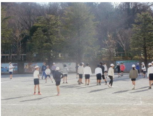
4年生 クラブ活動体験

いつもは5・6年生で活動しているクラブ活動ですが、この回は4年生も一緒に活動しました。いつもより賑やかな活動風景となりました。