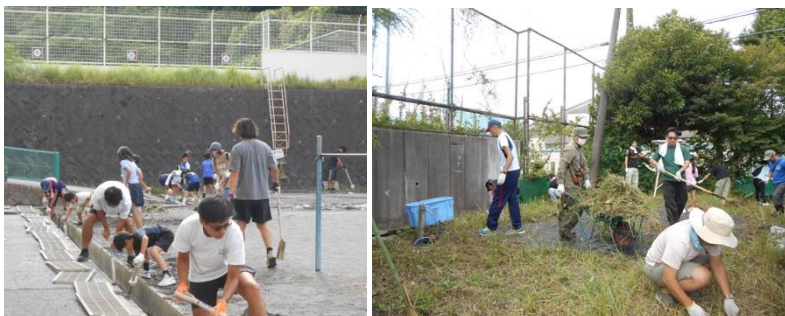
残暑の中、汗を流して頑張ってくださいました。

新林小学校が多くの皆様に支えていただいていること改めて実感する校庭清掃となりました。ご協力に心から感謝申し上げます。ありがとうございました。