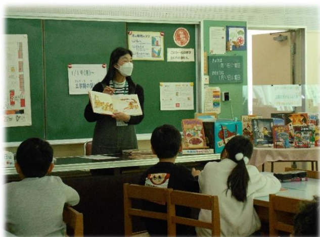
学校図書館専門員によるアニメシオンの授業

アニメシオンとは、子どもたちが読書を楽しみ、本を読む力を引き出す読書教育法です。