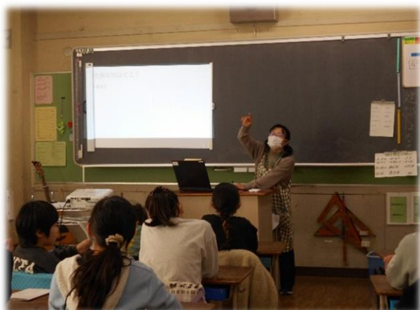
養護教諭による保健指導(全学年)