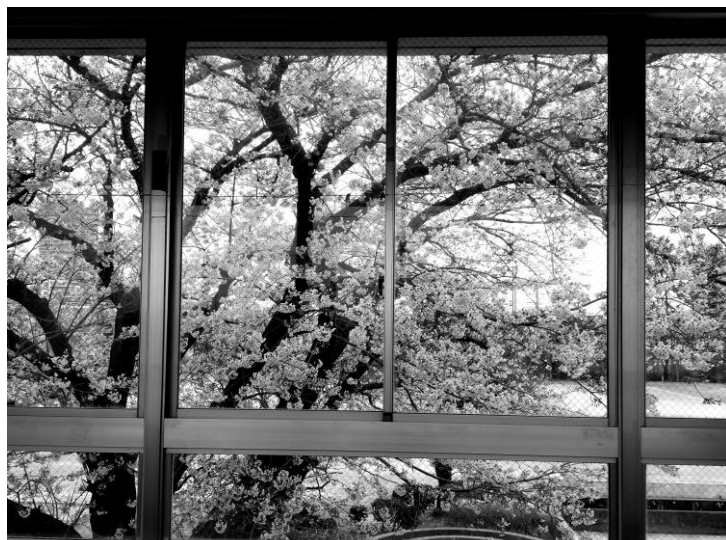
4月5日、渡り廊下にて

また、5月より、毎月月初めの日（8月を除く）に確認メールを送信します。メールが届かない場合は携帯・スマートフォンの設定をご確認ください。機種変更した場合も再登録が必要です。不明な点は担任までお問い合わせください。