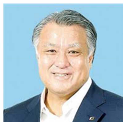
【講師】田嶋 幸三 氏 日本サッカー協会名誉会長