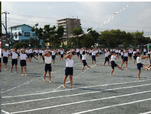
F e s t i v o