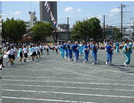
2年生と老人会の方々 と一緒に湘南台音頭