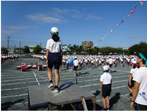
オリジナルの全校体操