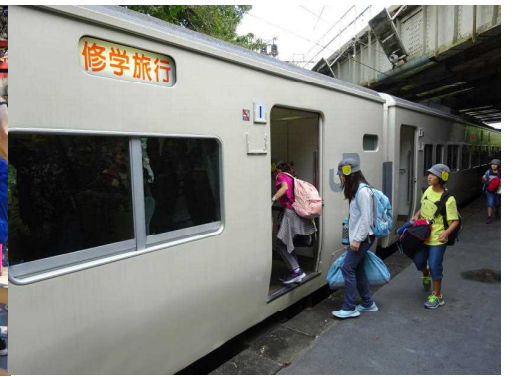
日光に別れを告げて