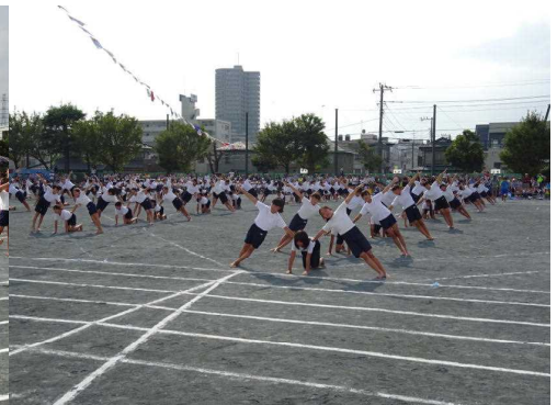
5・6年のリズム組み体

運動会の実施に当たりましては、PTA役員を始め、保護者のボランティアの皆様、地域の方々に子どもたちの安全に対するお力添えを頂き、誠にありがとうございました。