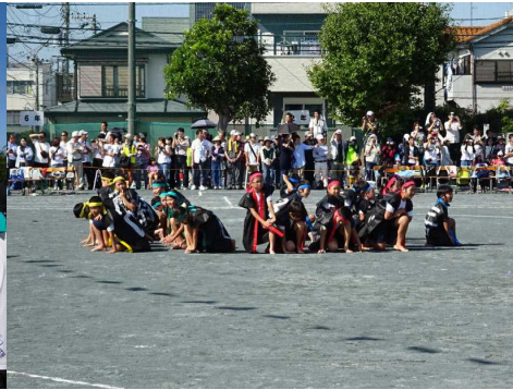
勇壮な湘小ソーラン