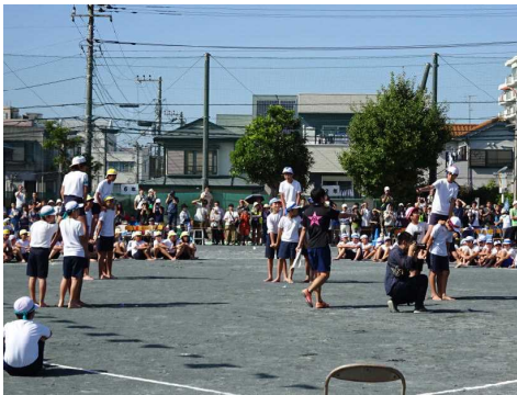
5・6年による騎馬戦