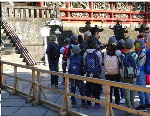
東照宮での班別行動