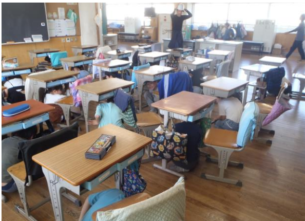
机の足を持ちながら身体を守る

大きな地震が起きたときは揺れが収まるまで、火災のときには煙から身を守りながら、自分の身体を自分で守る意識が大事です。ショート訓練を繰り返し行い、意識を高めています。