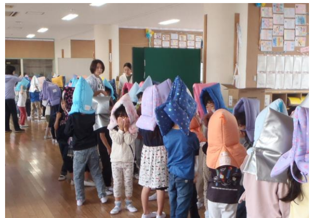
ハンカチなどで鼻と口を覆って避難