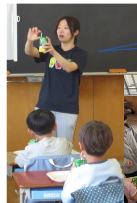
給食前指導の様子です