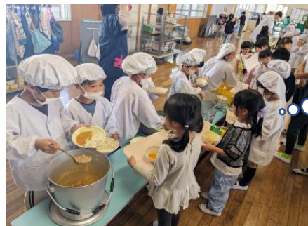
お当番のお仕事は 楽しいな♪