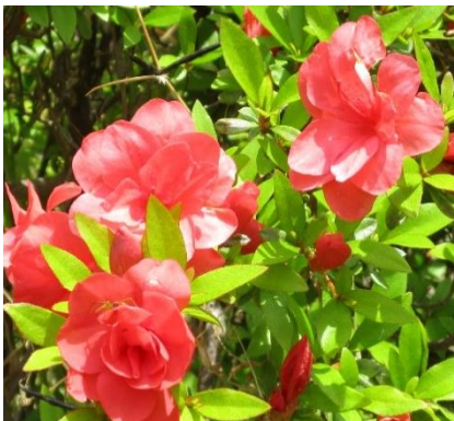
□ 北校舎付近で咲いています その1