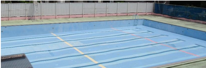
□ 6年生がきれいにしてくれたプール 保護者の方もお手伝いいただきました