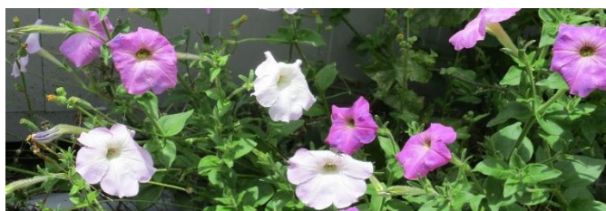
□ 北校舎付近で咲いています その2