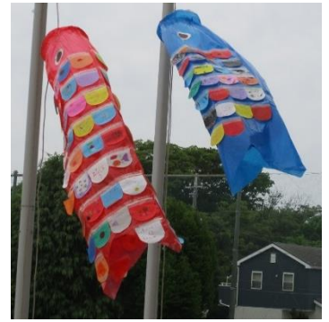
□1年生が作ったこいのぼり

21日、22日の二日間、計画委員会の5、6年生が校門や昇降口付近で挨拶運動を行いました。「おはようございます」という声はちょっと恥ずかしそうでしたが、低学年の子はうれしそうに返事をしていました。立っている6年生に声をかける1年生もいて、朝の昇降口がいつもより和やかな雰囲気のように感じました。