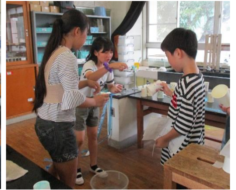
□調理場たんけん (2年)