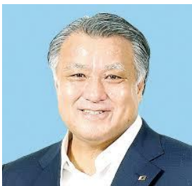
【講師】田嶋 幸三 氏 日本サッカー協会名誉会長