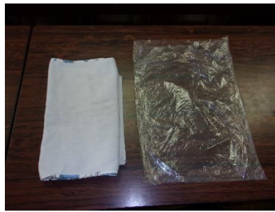
③ 新聞の上にタオルを置きます。厚めのビニールを用意