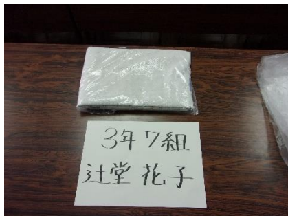
⑤ クラスと名前を書いた紙を用意