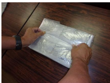
⑧ 養生テープ（ガムテープ）ではって飛び出さないようにします