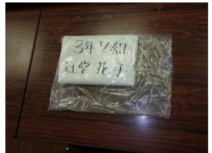
⑦ さらにビニールを用意して中に入れます