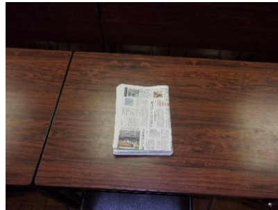
② 2回折って1/4にして重ねます