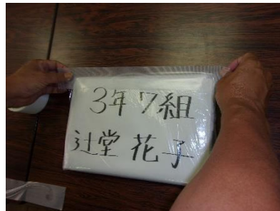
⑨ 表にして補強のため四隅を養生テープ（ガムテープ0）ではって完成！！