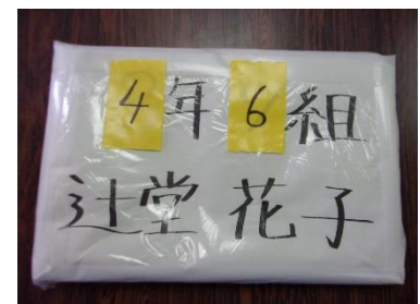
来年も使用する場合は学年と組の上にテープをはって変えます

表のビニールが破れる心配があるときはテープで補強し、上からマジックで学年、組、氏名を書いてもよい。