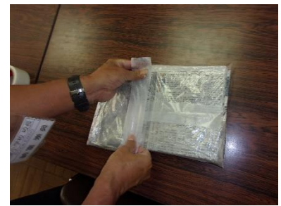
④ ビニールに入れて養生テープ（ガムテープ）ではありません