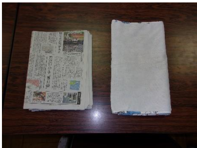
③ 古いタオルを用意します