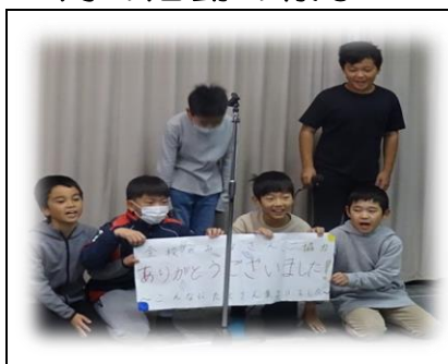
朝のつどいというテレビ放送で、お礼を伝えてくれた服のプロジェクト学習をプロジェクトにする5年生!