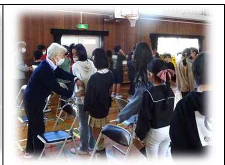
4年生:福祉体験で、アイマスクをつけて誘導の練習をしました。視角障害の方が安心して歩けるように考えます