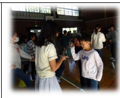
集会員の企画「ピラミッドじゃんけん」は、休み時間にじゃんけんする元気な声が響き渡っていました