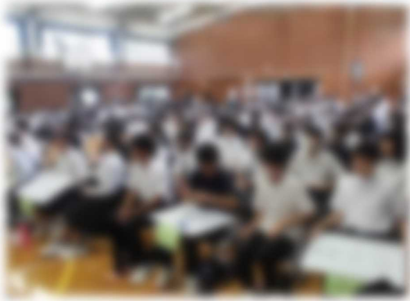
【体育館での生徒会クイズ】