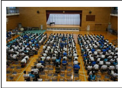
会場準備ありがとう

この日のために、文化祭実行委員をはじめ、文化部や委員会、教科係が準備をしてきました。友達や先輩の作品を通して、学びや気づきがあったと思います。展示物やステージ発表など見たり聞いたりする楽しさがありましたが、それを楽しんでいる‘みんなの笑顔’が見られたことが一番嬉しかったです。