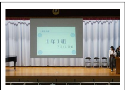
美化委員：SI グランプリ優勝1組