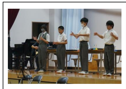
8組：演奏と手話による歌