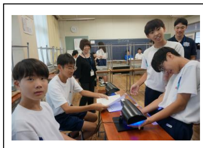
保健委員：手洗いチェック