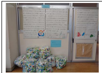
福祉委員：ペットボトルキャップと掲示物