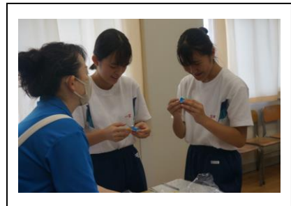
青少協：折り紙コマグネット作り