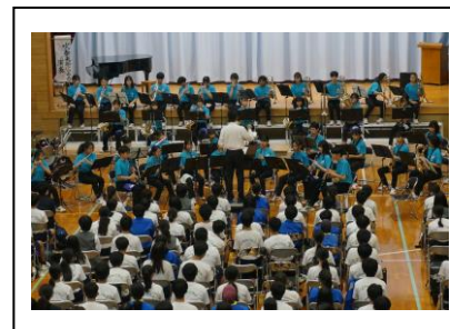
吹奏楽部：迫力ある演奏