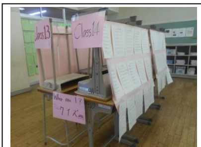
英語：英語で自己紹介