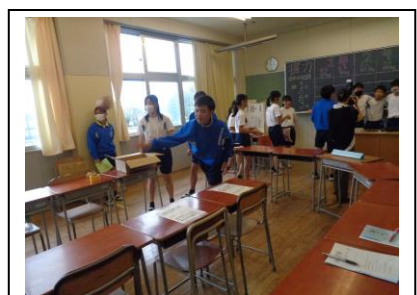
体育委員：シン体カテスト