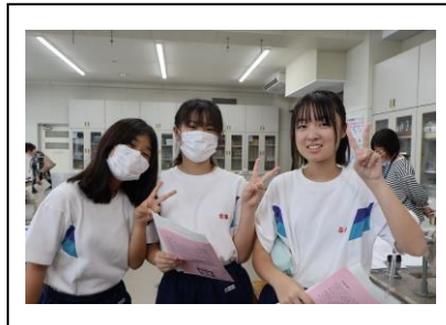
理科：自由研究見学中