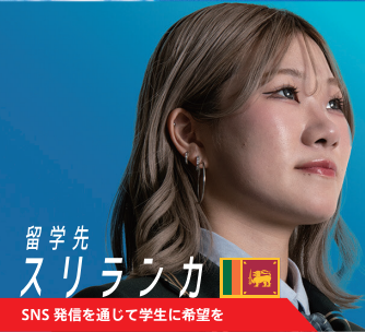
留学先 スリランカ 🇱🇰 SNS 発信を通じて学生に希望を