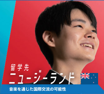
留学先 ニュージーランド 🇳🇿 音楽を通じた国際交流の可能性