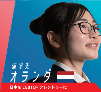
留学先 オランダ 🇳🇱 日本を LGBTQ+ フレンドリーに