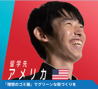
留学先 アメリカ 🇺🇸 「理想のゴミ箱」でグリーンな街づくりを