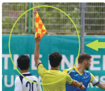
サッカー競技は旗を使用

他にもサッカーやラグビーなど、審判の笛の合図はどのようにしているのでしょうか。審判は笛を鳴らすとともに、旗をあげたり手をあげたりして選手に知らせます。選手が「目」でわかるように、様々な工夫が整えられています。