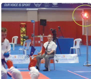
空手競技ではランプを設置