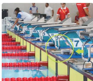
水泳競技場のスタートランプ