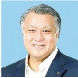
【講師】田嶋 幸三 氏 日本サッカー協会名誉会長